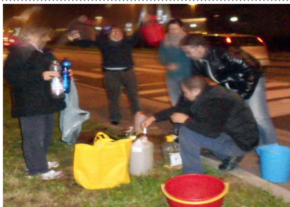
25/11/12- Gli esasperati inquilini di San Lorenzo a Greve ad una derivazione di fortuna in Via Tiziano, dopo che l'autoclave condominiale è andata di nuovo in blocco

interi week-end e decine di ore senz'acqua potabile a causa di continui blocchi dell'impianto autoclave.